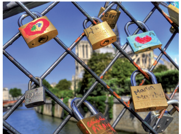
Les Italiens ne laissent rien au hasard à la Saint-Valentin

Il est courant en Angleterre d'envoyer des lettres d'amour le jour de la Saint-Valentin, souvent des poèmes ou des marques d'affection originales. Elles sont envoyées anonymement, de sorte que le destinataire ne sait pas de qui elles proviennent. Les États-Unis ont une tradition semblable. On y envoie en général des cartes de la Saint-Valentin agrémentées de nombreux cœurs et affranchies avec des timbres spéciaux.