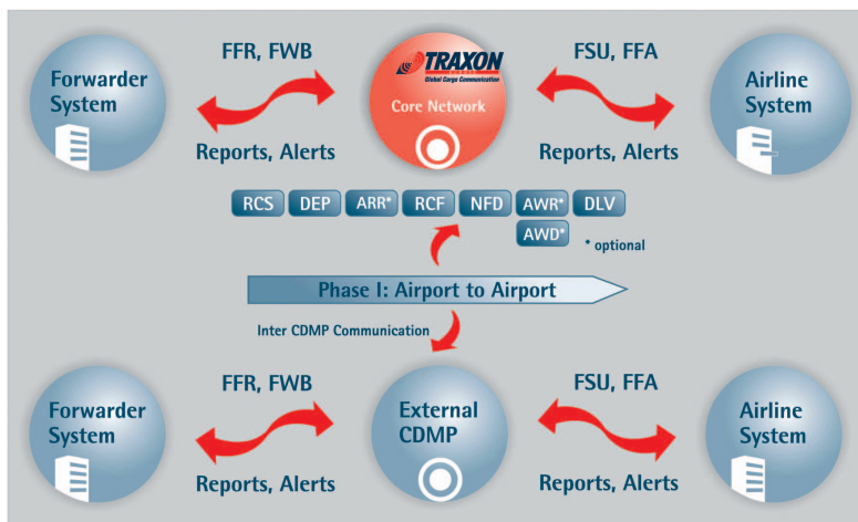
Flux d'information via TRAXON CDMP

Le temps et l'argent consacrés au suivi manuel détaillé des expéditions de fret aérien et au traitement des irrégularités en sont réduits. Le personnel dispose d'une meilleure vue d'ensemble de son travail et se trouve en mesure de mieux le planifier.