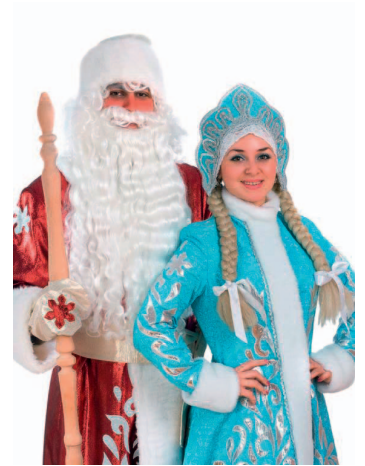
Les personnages du Noël russe Ded Moroz (Grand-père Gel) et Snegurochka (Fée des neiges)

La plupart des gens dans la CEI et dans les États baltes prennent leurs vacances en janvier, en général du Nouvel An au 15 janvier et souvent même plus longtemps. Ceci s'explique par le fait que la fête religieuse de Noël suit les célébrations du Nouvel An. Si vous voulez aller en Russie pour affaires, évitez le mois de janvier.