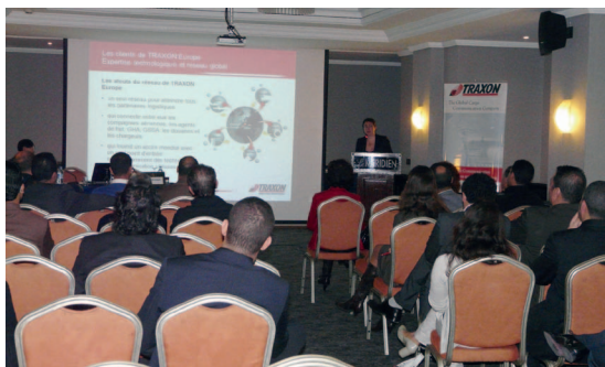
Présentation de TRAXON Europe lors du Forum TRAXON au Maroc

Au mois d'octobre, TRAXON Europe a organisé à nouveau un forum TRAXON à Casablanca, Maroc. L'objectif était de promouvoir l'initiative IATA e-freight dans la région. Au cours de l'événement, TRAXON a présenté son important portefeuille e-freight avec des produits tels que TRAXON Line , eCargo Pouch® ainsi que les différentes solutions Air Cargo Customs . Quelque 38 agents de fret, agents de maintenance au sol et représentants de compagnies aériennes ont assisté à la manifestation. Le Forum était organisé en coopération avec Royal Air Maroc (RAM) et IATA Maroc. La compagnie RAM a l'intention de faire démarrer les expéditions e-freight en 2012. Tous les participants, intervenants et invités se sont réjouis de la qualité et de l'animation du débat sur le fret électronique.