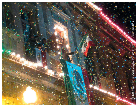
Le président de la municipalité prononce le « grito » de « Viva Mexico » comme coup d'envoi aux festivités du Jour de l'Indépendance au Mexique.

C'est une grande fête que tous les Mexicains adorent célébrer. Elle nous rappelle qui nous sommes et ce dont nous sommes si fiers : un pays doté d'une histoire captivante, d'une culture magique, de merveilleux endroits à visiter, d'une foule de spécialités culinaires succulentes, et d'un peuple très chaleureux, généreux et sympathique, un pays dans lequel la vie de famille et les réunions familiales occupent encore une place de premier plan.